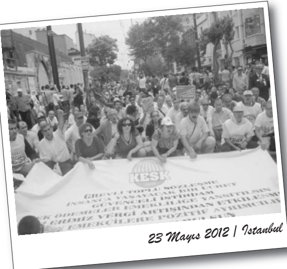
23 Mayıs 2012 | İstanbul