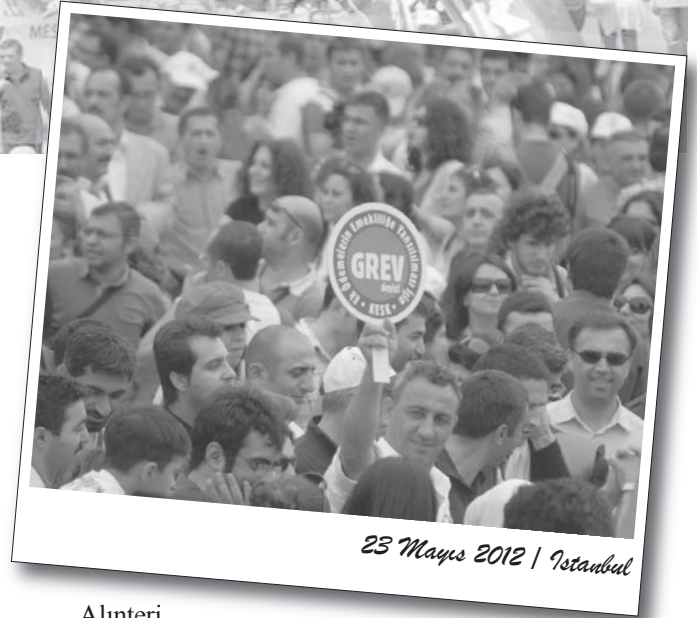
23 Mayıs 2012 | İstanbul

Sendikaların ardından ilerici ve devrimci kurumlar yer aldı. HDK İstanbul Meclisi, BDP, SODAP, ESP, Tekstil Sen, EMEP, Sosyalist Kuruluş, Kaldıraç, EHP, Mücadele Birliği, Devrimci Hareket, TİM-İGD,