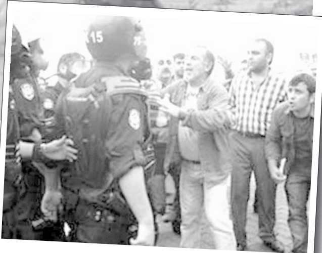
31 Mayıs 2011 | Hopa